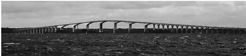
Pamje nga ura dhe deti Baltik.

Ëlandin, më tepër e kam zgjedhur si një ujdhesë shqiptare, se kështu e paramendoja. Edhe Herliga Birgita (Shenjtorja Birgita), e ka bustin këtu. Kur ajo shkoi në Itali, e gjeti një ujdhesë si Ëlandin. Ajo ndërroi jetë dhe e sollën në Suedi.