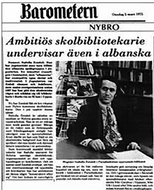
Daja, në një nga gazetat e njohura suedeze. (Dëshmi për hapjen e shkollës së parë shqipe në Suedi, 5 mars 1975.)

i kanë ndodhur dje dhe koha i kishte konservuar aq mirë në memorien e tij. Megjithatë, ne po shkëpusim ndonjë fragment, edhe pse secili tregim është interesant dhe, siç thamë në krye të herës, ngjajnë si seritë e një filmi në proces, ose i papërfunduar ende.