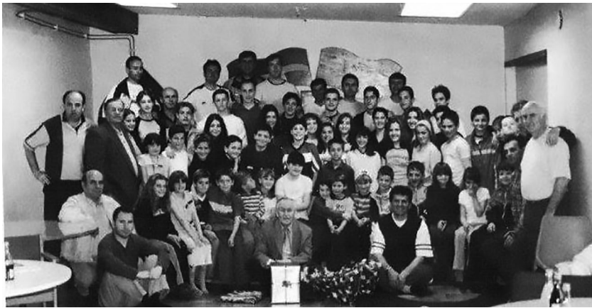
Daja me prindërit dhe nxënësit e shkollës shqipe në Nybro, Suedi, 2001.