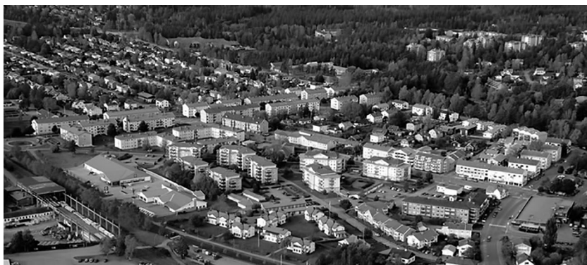
Pamje nga qyteti Nybro, Suedi.