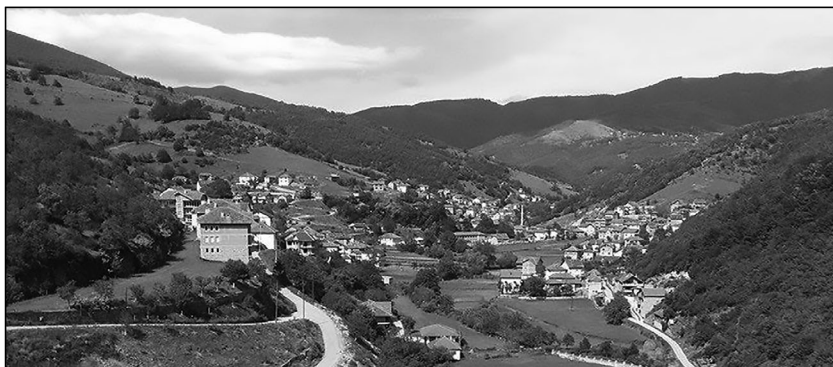
Pamje nga Sërmmova, vendlindja e Dajës.

Pata ardhur këtu për një kohë të shkurtër, por rrethanat e jetës më bënë të jem ai që jam sot. Mua më shtyu jeta e mërgimtarëve, unë do të shkoj prej këtu, por do të mbetem ai tjetri, se i kisha 45 mijë shqiptarë pas vetes... Prandaj është “Ditari i dhimbjeve”, se jeta e bën të veten.